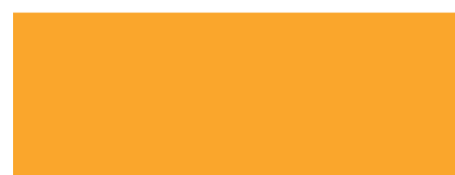
GIALLO COD. 901