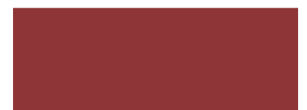
ROSSO COD. 401