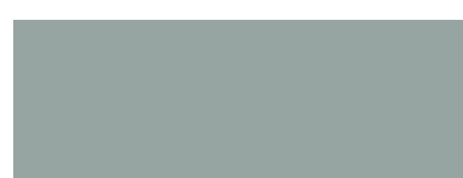
GRIGIO PERLA COD. 801