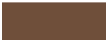
CUOIO COD. 203