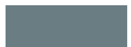
GRIGIO MARINA COD. 803

Le tinte presenti in cartella sono soggette ad alterazioni e sono quindi da considerarsi indicative.