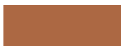
LARICE COD. 400