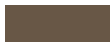
NOCE SCURO COD. 284