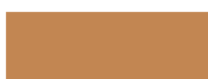
TEAK COD. 965